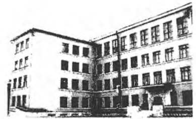
Gymnasium № 86

Gymnasium № 86 Konstituziistraße 2a/ 450064 Ufa/ Russland/ (3472) 429719